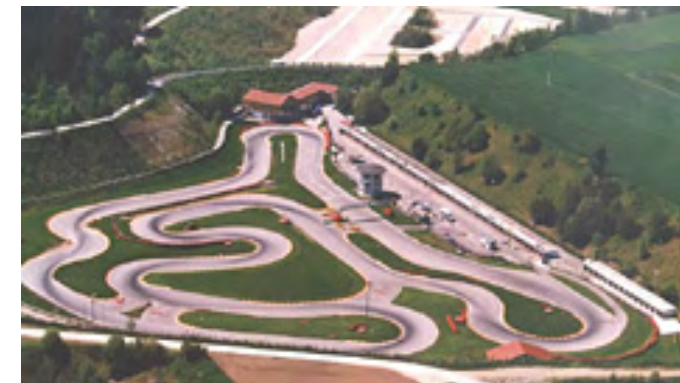
29. / 30. September 2012 Ampfing Goldpokal von Deutschland Letzter Lauf zur DMV Kart Championship