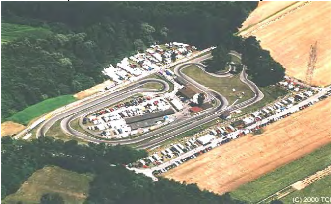
1. April 2012 Liedolsheim Lauf zum Rhein - Main - Kart - Cup

Der KCD'90 veranstaltet im Jahr 2012 drei Läufe zur DMV Kart Championship , darunter der Goldpokal des DMV in Ampfing und zwei Läufe zu der Clubsportserie Rhein Main Kart Cup .