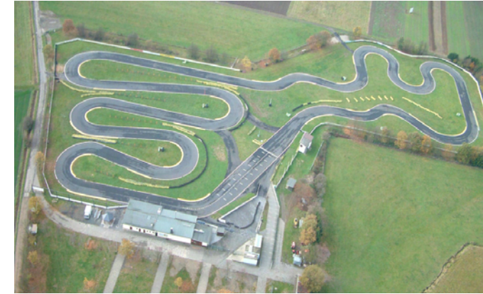
19. August 2012 Oppenrod Motorsportarena Stefan Bellof Lauf zum Rhein – Main – Kart - Cup